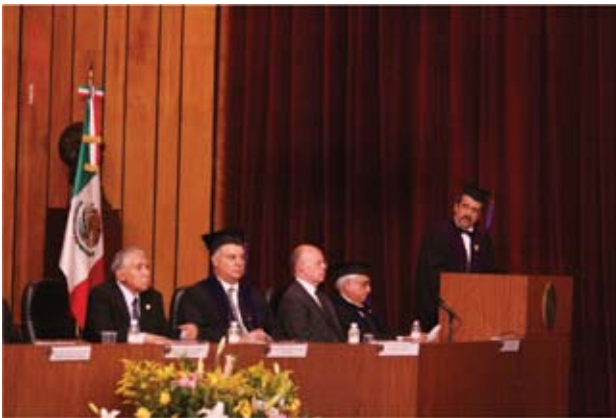
El recién nombrado Académico de Número, Dr. José Angel Córdova Villalobos, dirigiendo su discurso, en representación de los nuevos Académicos ingresados

El ingreso a esta noble institución nos confiere una gran responsabilidad con la membresía misma. Pero nos comprometemos aún más con la sociedad.