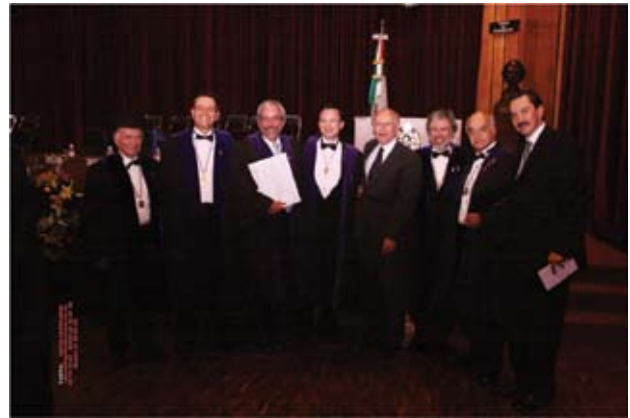
Algunos de los asistentes al evento

Mil gracias por acompañarnos esta noche, tan relevante en nuestra historia personal, y mil felicidades a todos mis compañeros.