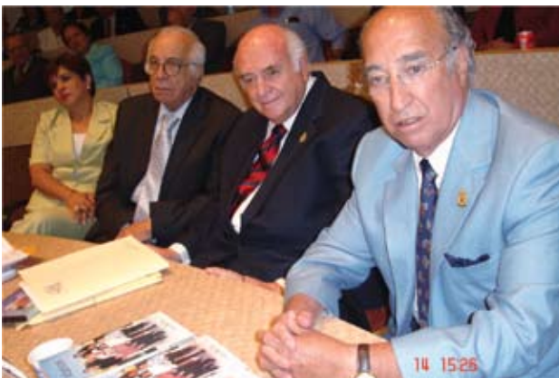
Vista parcial de algunos de los asistentes al evento