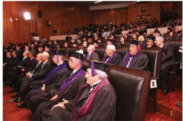
Aspecto general de la concurrencia en el auditorio, durante la Sesión Solemne

“Cada togado lleva bajo su atavío académico su vida de trabajo, su voluntad de hacer el bien y si luce sus insignias, es como oportuna gala de su grandeza espiritual. Sed bienvenidos ilustres colegas a esta Academia que desde hoy es vuestro hogar científico”.