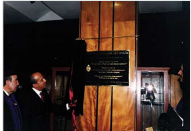
El C. Presidente Lic. Felipe Calderón Hinojosa, develando placa conmemorativa

por un México Sano", propuesto por el C. Presidente de los Estados Unidos Mexicanos, Lic. Felipe Calderón Hinojosa. México, D. F., 12 de Junio, 2007.