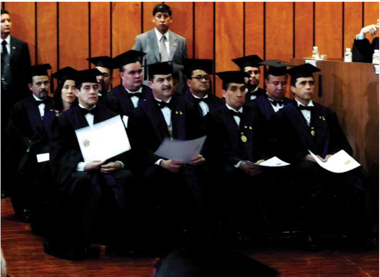
Grupo de Académicos de Número de nuevo ingreso