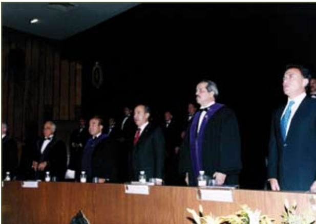
H. Presídium, haciendo honores a la Bandera Nacional

Mexicana, procediera a la entrega de diplomas, a los Señores Académicos Titulares que pasan a Eméritos por cumplir 20 años de actividad en la Corporación y a los Sres. Académicos que fueron promovidos de Miembros de Número a Titulares, por cumplir 10 años de desempeño científico académico en la AMC y haber sido aprobados todos por la Asamblea General Ordinaria. Recibieron la constancia de su nueva categoría, por orden alfabético.