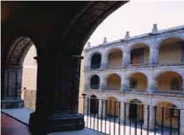
Interior del Antigua Colegio de San Ildefonso

una vez más de manifiesto al acudir los asistentes a una comida al finalizar el recorrido, al ya conocido y celebre Restaurante El Cardenal, ubicado en Palma 23, Centro, en donde se degustaron deliciosos platillos de la alta comida mexicana.