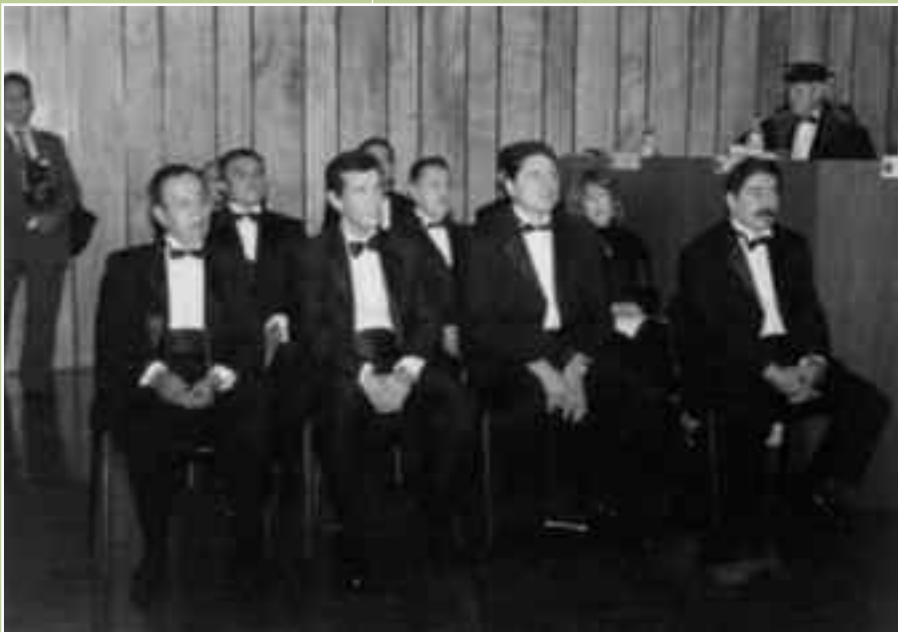
Académicos de nuevo ingreso.