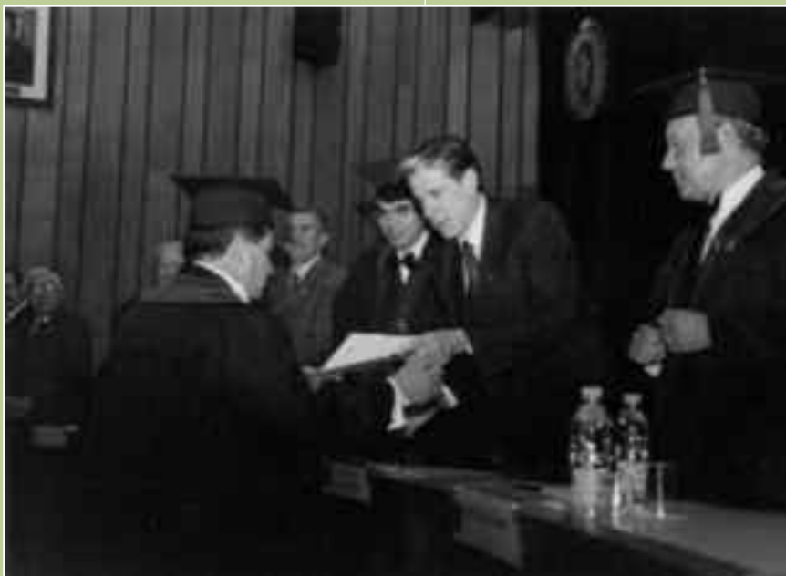
Entrega de diplomas e insignias por el C. Dr. Julio Frenk Mora, Secretario de Salud.