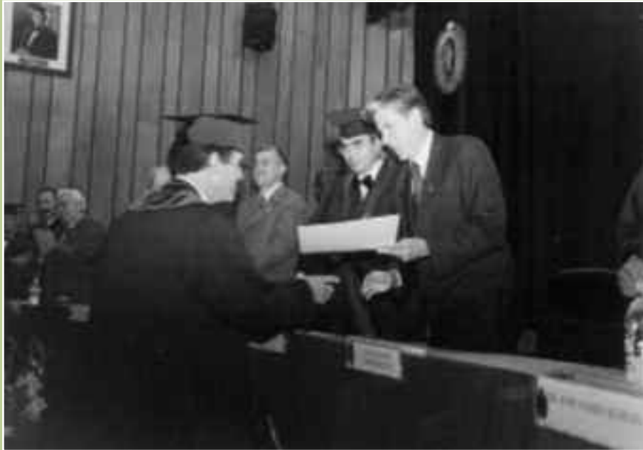
Entrega de diplomas a los Académicos de Número por el C. Dr. Julio Frenk Mora, Secretario de Salud.