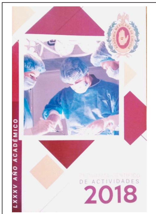
Figura 1. LXXXV Aniversario de la Academia Mexicana de Cirugía.

Estimados señores Académicos, su asistencia es fundamental para el éxito de las sesiones ordinarias, ya que es indispensable contar con su opinión crítica y reflexiva, con lo que lograremos sesiones de alto valor científico para toda la comunidad médica; pero, sobre todo, para lograr mejoras en