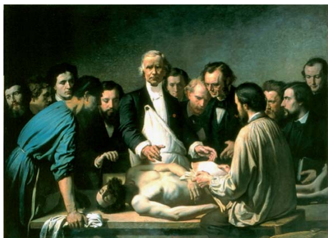
Figura 1. La profesión del cirujano merece un retiro exitoso y homenajeado.

A principios del siglo XX la jubilación laboral no se incluía en ninguna legislación. Incluso las jornadas laborales no estaban debidamente reglamentadas. Poco a poco los trabajadores lograron leyes laborales justas, que incluyeron la jubilación o el retiro y la pensión. Desgraciadamente en México no todos los habitantes gozan de esos beneficios, ya que muchos laboran de manera informal, sin apegarse a ningún régimen fiscal o laboral. La mayoría de las instituciones jubilan a los trabajadores después de cerca de 30 años de trabajo. La mayoría de las jubilaciones ocurren entre los 55 y 65 años de edad.