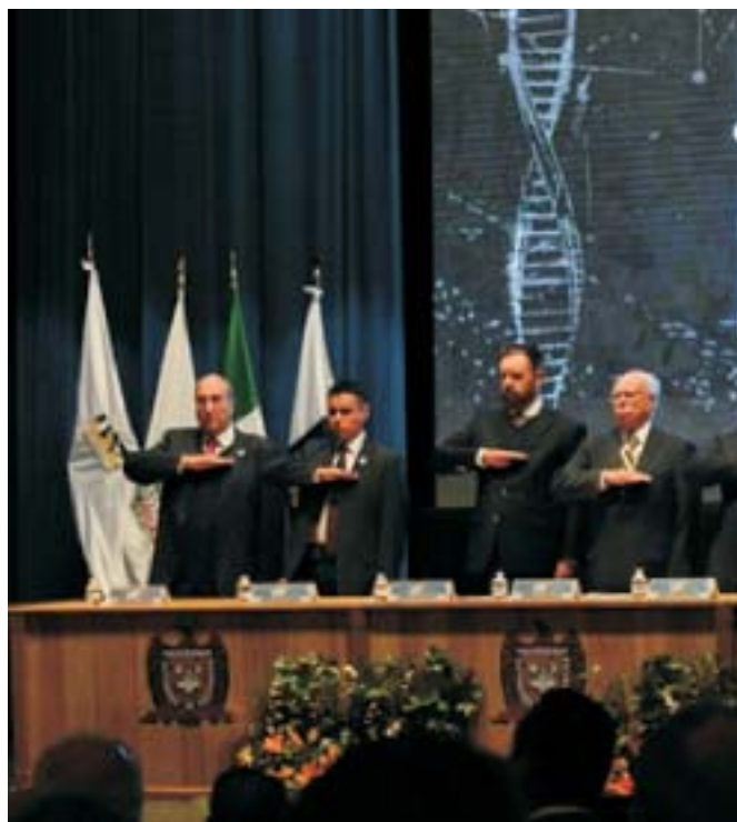
Figura 2. Honorable presidium, Dr. José Narro Robles, Secretario de Salud; L.C. Alejandro Tello Cristerna, Gobernador del Estado de Zacatecas.