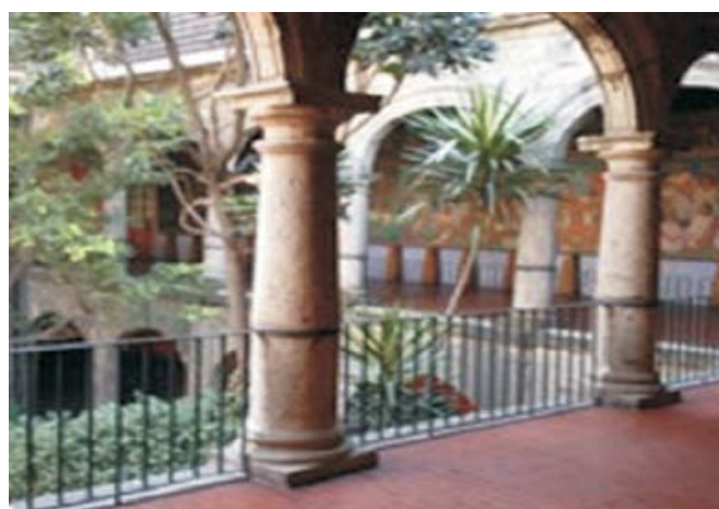
Figura 2. Hospital de Jesús.