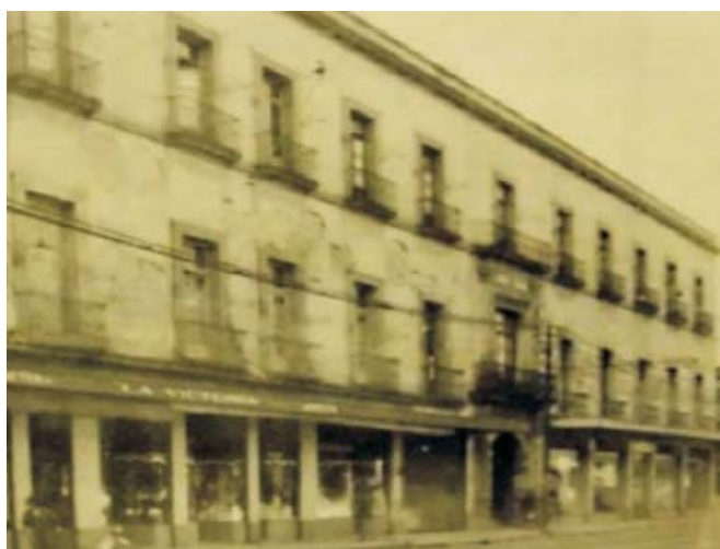
Figura 1. Hospital Real de Naturales, sede del Real Colegio de Cirugía de la Nueva España.

Finalmente, Montaner y Moreno contaron con el apoyo del Virrey de la Nueva España Carlos Francisco de Croix, para poder iniciar las actividades del Colegio. De esta manera se logró