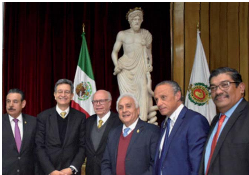
Figura 2. Miembros de la Academia Mexicana de Cirugía.