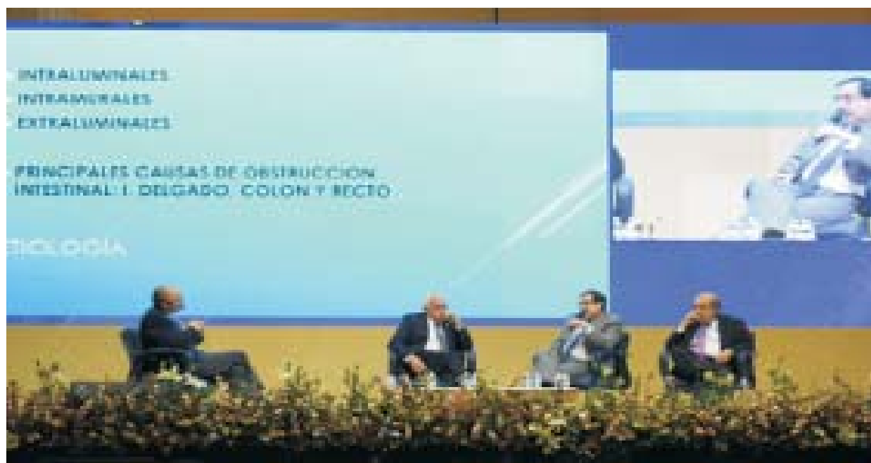
Figura 4. Mesa redonda "Obstrucción intestinal".