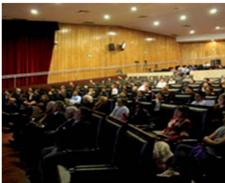
Figura 3. Asistentes a las sesiones ordinarias de la Academia Mexicana de Cirugía.