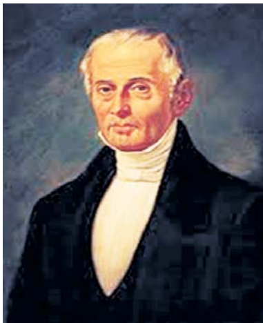
Figura 1. Dr. Valentín Gómez Farías.

Actualmente se calcula que en nuestro país 80% de los médicos labora en las áreas urbanas, por