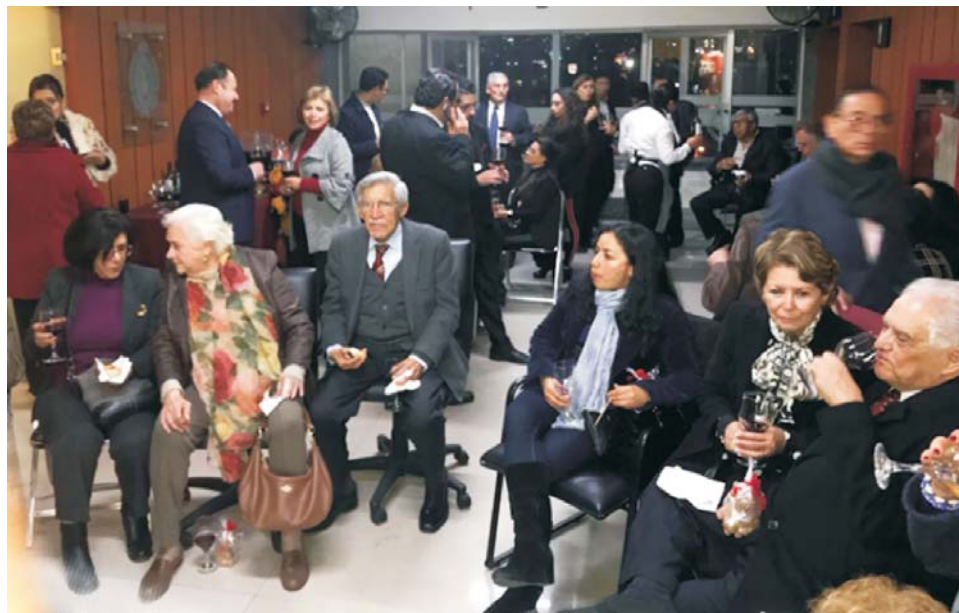
Figura 5. Aspecto general del convivio.