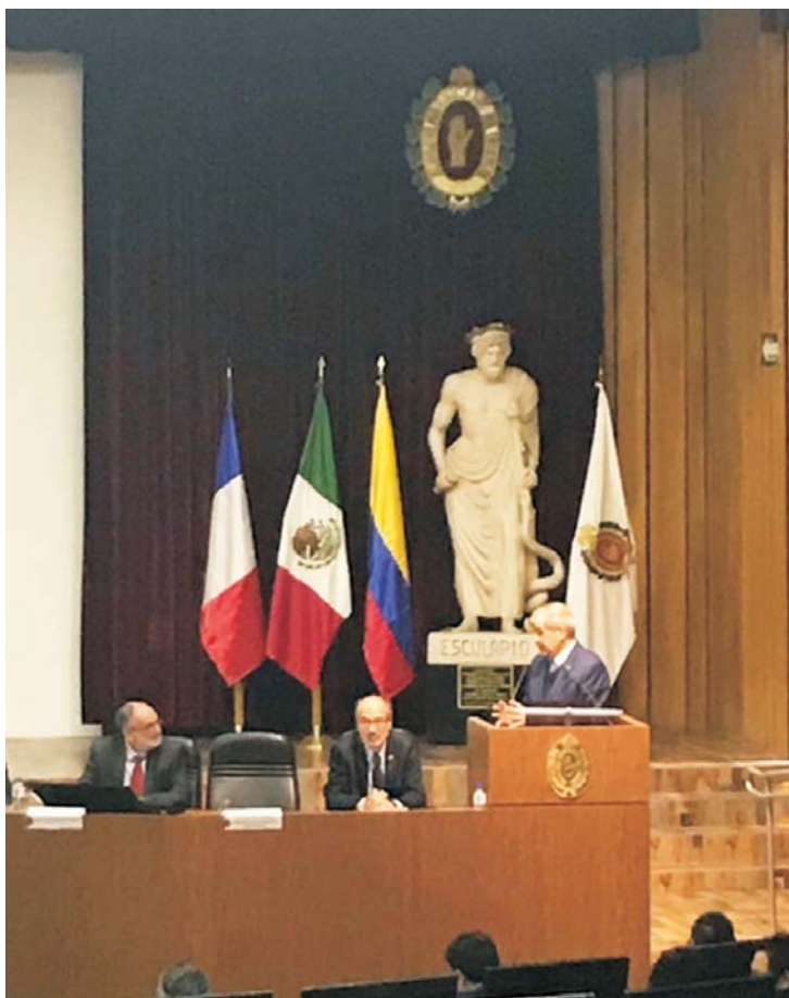
Figura 4. Aspecto de las Conferencias.