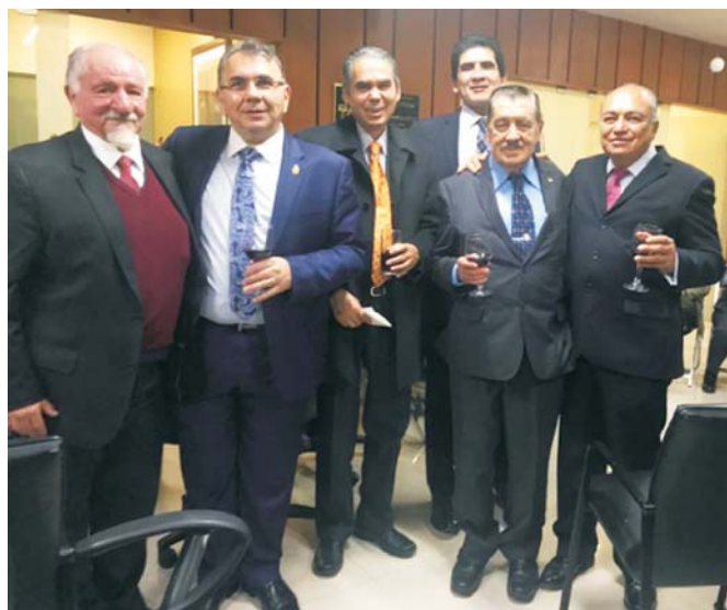
Figura 4. Académicos y miembros de la AMCAD.