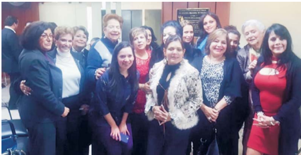
Figura 2. Algunas integrantes de la Sociedad de Esposas de Cirujanos Académicos (SECA).