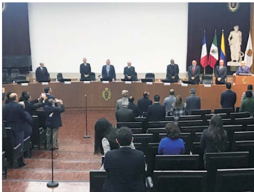
Figura 3. Aspecto General de la Ceremonia Inaugural del Foro.