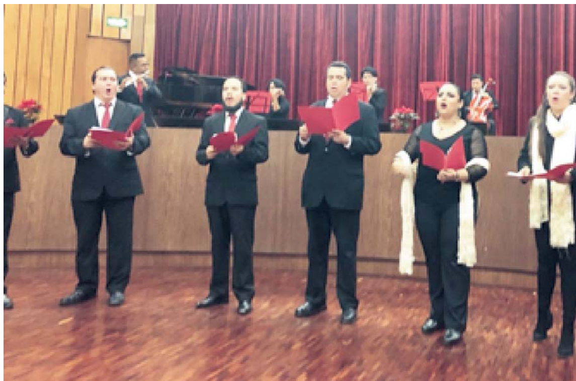
Figura 1. Concierto Cantata Navideña. Ensamble Christmas Romanza.