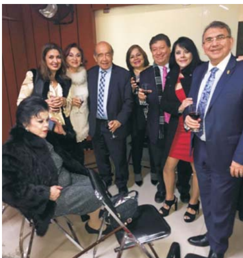
Figura 3. Académicas, académicos y acompañantes asistentes al concierto y brindis navideño.