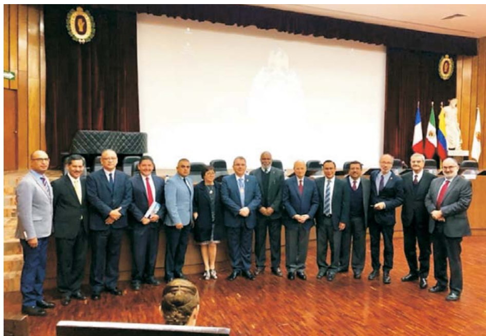
Figura 5. Algunos de los profesores participantes.